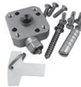
Embrague con 4 -agujeros Icelock 4H 214 para MSS